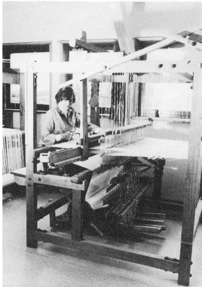
Abb. 3 Bei der Arbeit am Handwebstuhl

der weiterhin durch ein regelmäßiges Treffen in der Spinnstube gepflegt wird. Anklang fand auch die Bandweberei, eine alte aber heute noch interessante Arbeitstechnik aus den Anfängen der Handweberei, die an der Volkshochschule Polle als Kursus ausgerichtet wurde. Als eine Pflege des Weberhandwerkes werden die Treffen der Lehrlinge, Gesellen und Meister der ehemaligen Webschule Bückeberg verstanden, die 1979 erstmalig in der Handweberei Polle abgehalten 9) und in den folgenden Jahren mehrfach wiederholt werden konnten. 10)